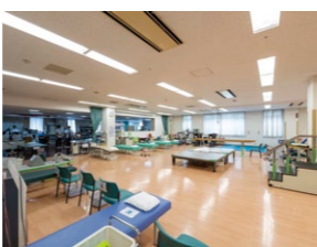
上)みたき総合病院本館1階にあるリハビリテーション室 右)リハビリテーション科の皆さん。みたき総合病院では、急性期から回復期、そして、在宅までのリハビリテーションに対応。今月より腎臓リハビリテーションを開始する