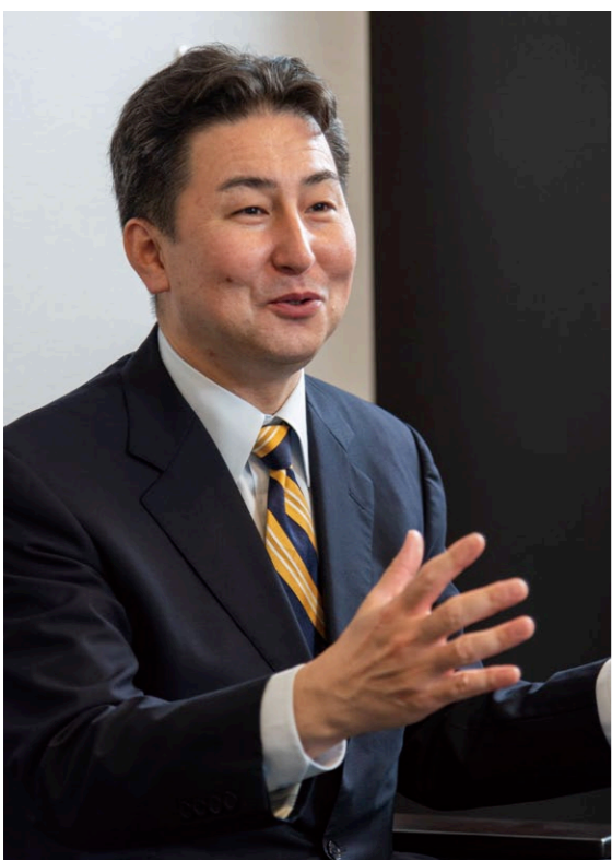
名古屋市立大学整形外科教授