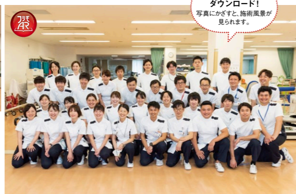
写真をダウンロード! 写真にかざすと、施術風景が見られます。

つてもらい、そのドクターからクラブへも連絡をしていただく。症状の把握のためにも、ドクターとの連携も大切だと思っています。子どもは無理をしても試合に出たがりま